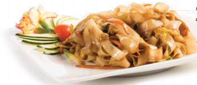
248 Pad thai

Tagliatelle di riso saltate con *gamberetti, *surimi e verdure miste